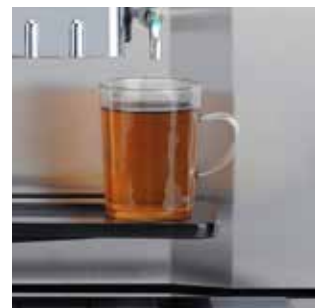
+ Aparte uitloop voor heet water