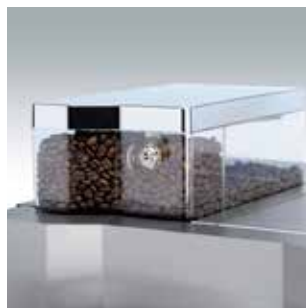
+ Verse koffiebonen