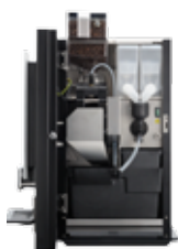
OB 3 (XL) NG