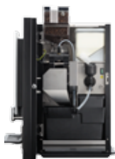
OB 2 (XL) NG